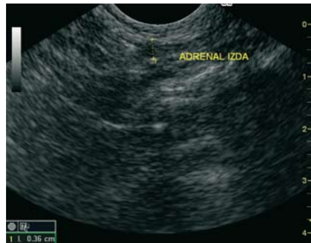
Figura 1. Imagen ecográfica de glándula adrenal izquierda.

nes de nódulos linfáticos regionales (linfocentro iliosacro principalmente). No se encontró ningún otro hallazgo ecográfico destacable.