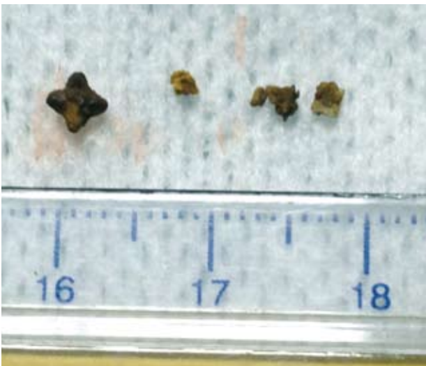
Figura 7. Urolitos de oxalato cálcico extraídos tras cistotomía.

realizó la extracción de los urolitos por cistotomía utilizando la misma técnica descrita en perros y gatos. Finalmente se extrajeron 5 cálculos urinarios (Fig. 7). El estudio cualitativo y cuantitativo de dichos urolitos (Minnesota Urolith Center, Veterinary Clinical Sciences Department, College of Veterinary Medicine, University of Minnesota) reveló que se trataba de urolitos 100 % formados por oxalato cálcico monohidrato.