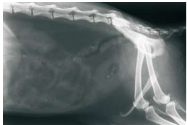
Figura 5. Radiografía lateral previa a la cirugía tras la urohidropropulsión. Obsérvense los urolitos en la vejiga de la orina.