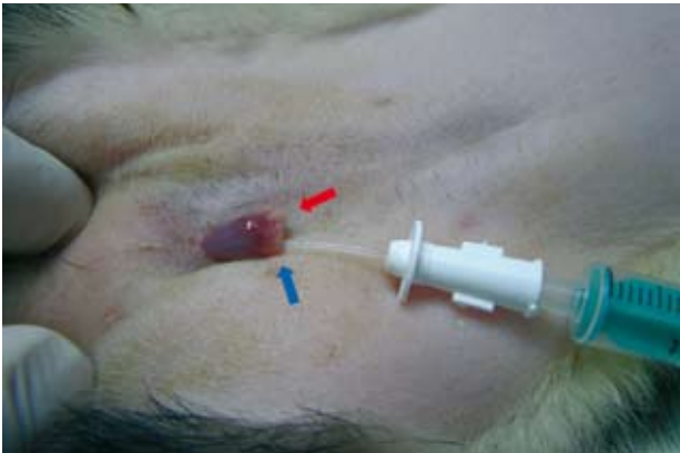
Figura 6. Cateterización de la uretra exteriorizando el pene del hurón. Se observa el hueso peneano (flecha roja) y la entrada de la uretra (flecha azul).