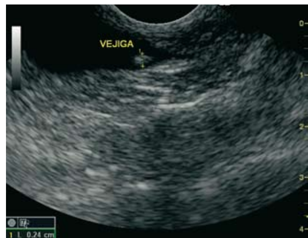
Figura 3. Imagen ecográfica de porción caudal de la vejiga (trígono vesical y porción prostática). Corte longitudinal.