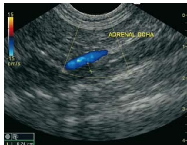
Figura 2. Imagen ecográfica de glándula adrenal derecha. Corte longitudinal. Obsérvese parte de la glándula íntimamente adherida a la pared de la vena cava.